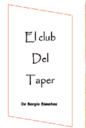
El club del taper

Fotografía: Andrés Garzas Música: Miguel Ángel Aijón