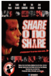
Share o no Share

Por septimo año consecutivo celebramos en Salamanca, y simultáneamente con el resto del planeta, EL DIA MÁS CORTO, una proyección de cortometrajes en la que este año hemos reunido algunos de los mejores cortometrajes cuyo tema central es "Media" y que, de alguna forma, tratan la influencia de los medios de comunicación en nuestra sociedad. El corto, por su capacidad de síntesis, contundencia y libertad, expresa muy bien las historias o relatos que quiere mostrar y, en muchas ocasiones, superando a otros medios más especializados o profesionales. Alex Ruano