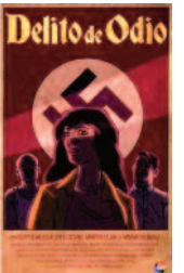
Delito de odio