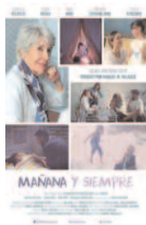
Mañana y siempre